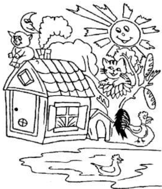
Рис. 157. Что перепутал художник?

158. Обведи, не отрывая карандаша. Дорисуй и раскрась.