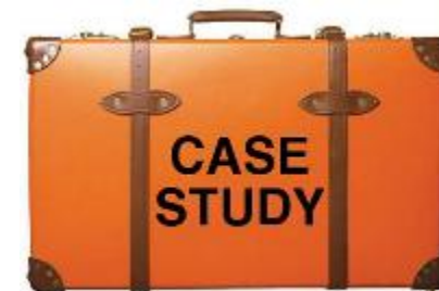
"Кейс - технологии" в ДОУ.